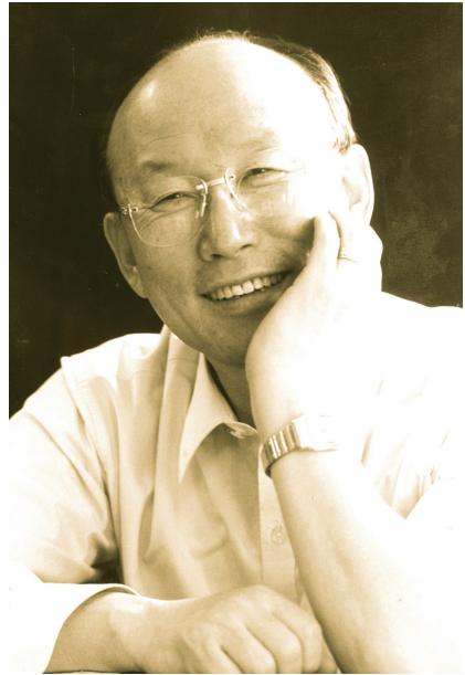
DCEM 총재 조용기 목사

내가 그리스도와 그 부활의 권능과 그 고난에 참여함을 알고자 하여 그의 죽으심을 본받아 어떻게 해서든지 죽은 자 가운데서 부활에 이르러 하노니 내가 이미 얻었다 함도 아니요 온전히 이루었다 함도 아니라 오직 내가 그리스도 예수께 잡힌 바 된 그것을 잡으려고 달려가노라 (빌립보서 3장 10절~16절)